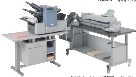
DI380 yhdistettynä DM550-postitusjärjestelmään tarjoo ihanteellisen ratkaisun..